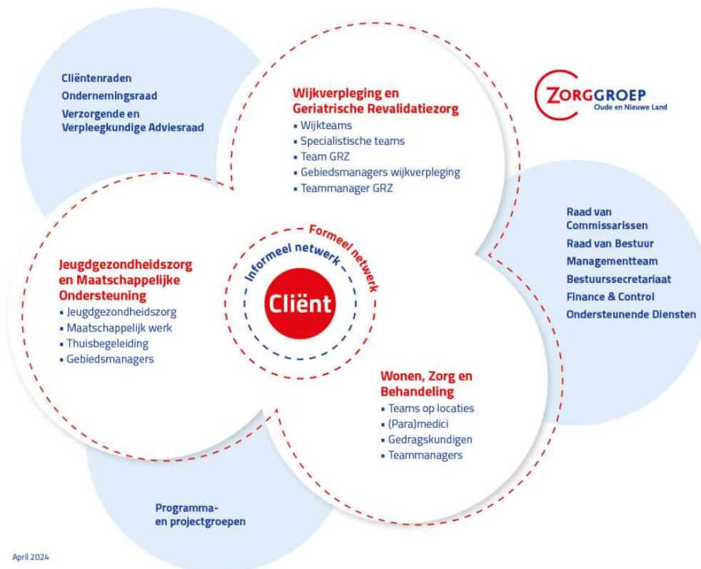
Figuur 2 Organogram