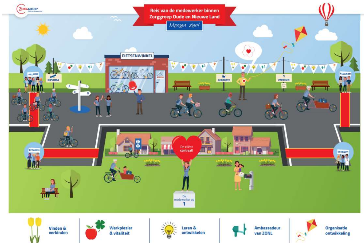
Figuur 3 Medewerkerreis