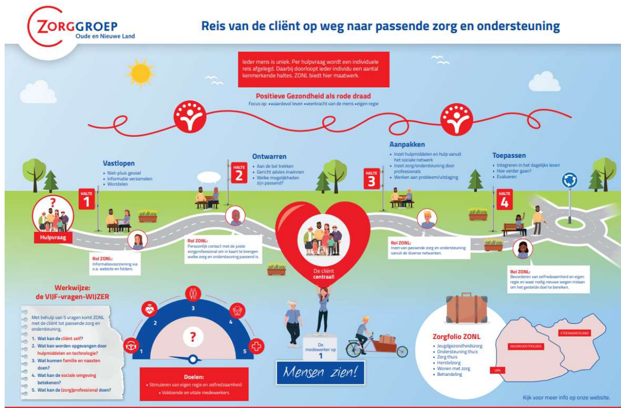
Figuur 4 Cliëntreis

Met deze herstructurering zet ZONL een belangrijke stap in het verder versterken van de kwaliteit van zorg en ondersteuning in de regio, terwijl het zijn strategische focus behoudt.